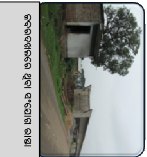
କରରଦଖଲରେ ଥିବା ସଂଯୋଗ ରାସ୍ତା