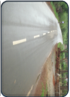
ରମନାଗମନ ଉପଯୋଗୀ ମୁଖ୍ୟ କରମ୍ପାସ ସତ୍ତ୍ୱେ ଏବଂ ଅର୍ଥ