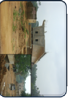
ଷେଷପୁରଠାରୁ ବୈରଗଣା ନଦୀ ପର୍ଯ୍ୟନ୍ତ ସାଇଲେଣ୍ଡଲ ବ୍ରିଜ୍