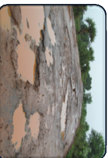
ଡେଇଫି ଅବସ୍ଥାରେ ମୁଖ୍ୟ କରମ୍ପାସ ସତ୍ତ୍ୱେ